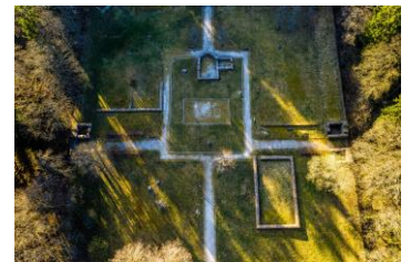
Die Römerkastelle Kleiner Feldberg (oben) und Kapersburg (unten) sind seit 20 Jahren UNESCO Weltkulturerbe.