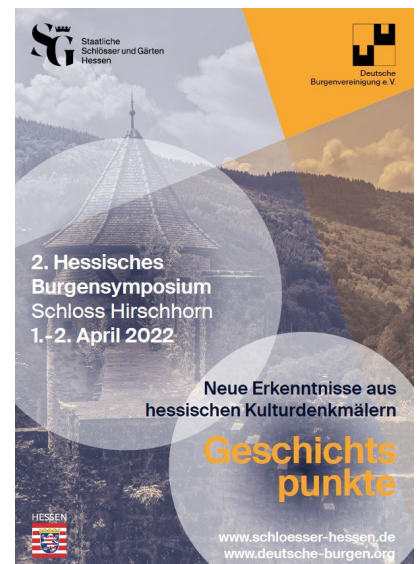
Plakat zum 2. Hessischen Burgensymposium © Staatliche Schlösser und Gärten Hessen, Grafik: bb | Bettina Burkardt