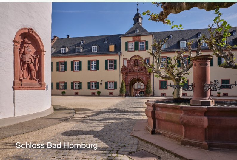
Schloss Bad Homburg

Online-Tickets: www.schloesser-hessen.de/schloss-bad-homburg/veranstaltungen