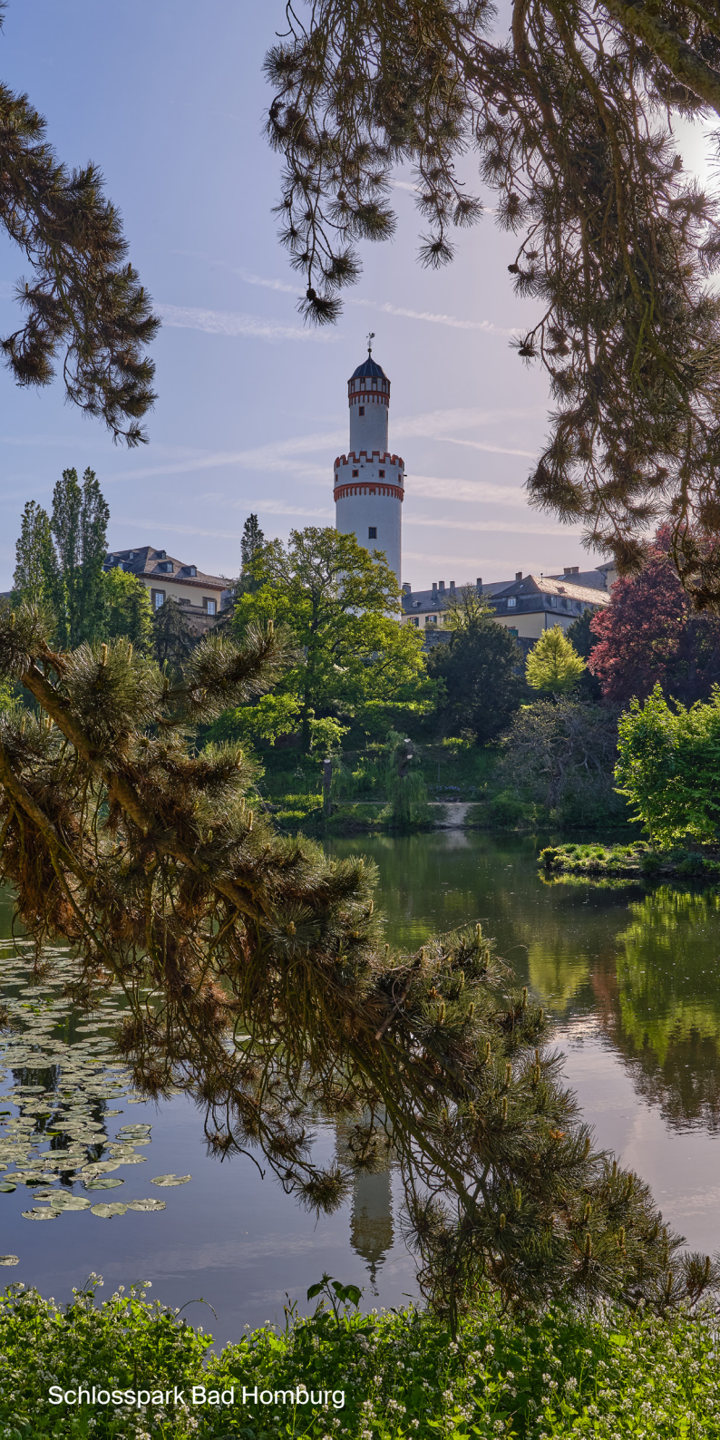
Schlosspark Bad Homburg