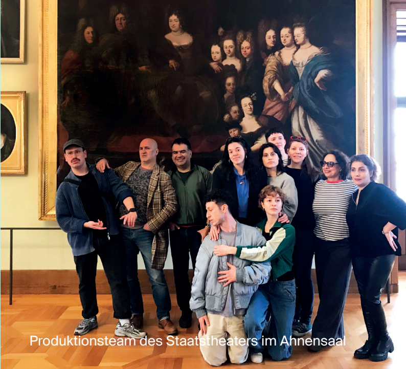
Produktionsteam des Staatstheaters im Ahnensaal