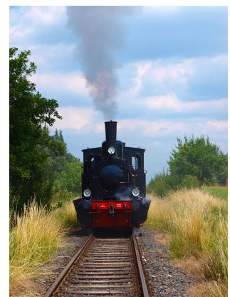
Die Anreise nach Münzenberg geht jetzt auf der Schiene

„Wir hoffen, dass der Ausflug zu dieser bedeutenden romanischen Burganlage und in die Münzenberger Altstadt für viele Menschen ein entschleunigter Zeitvertreib wird, und sind glücklich über diese Zusammenarbeit mit der Stadt und dem Verein“, sagte SG-