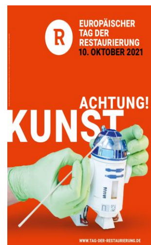
Plakat des Aktionstages © SG, Collage: VDR