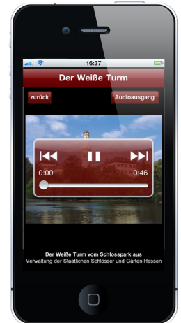
Schloss Bad Homburg