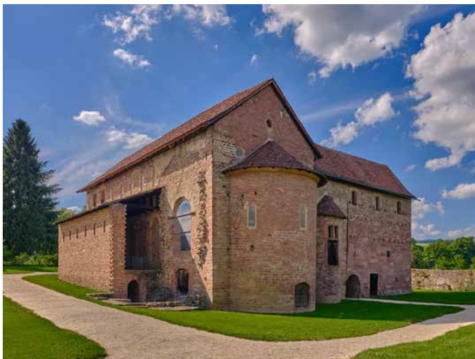
Basilika, Blick von Südosten

Einhard ließ hier, im heutigen Michelstädter Ortsteil Steinbach, zwischen 815 und 827 eine Basilika bauen. Diese, wie er selbst schrieb, „zur Abhaltung des Gottesdienstes geeignete prächtige Kirche von nicht unrühmlicher Art“ ist heute ein kunst- und architekturgeschichtliches Zeugnis ersten Ranges. Obwohl der Bau Spuren späterer Veränderungen zeigt, stammt die Substanz zum überwiegenden Teil aus der Karolingerzeit.