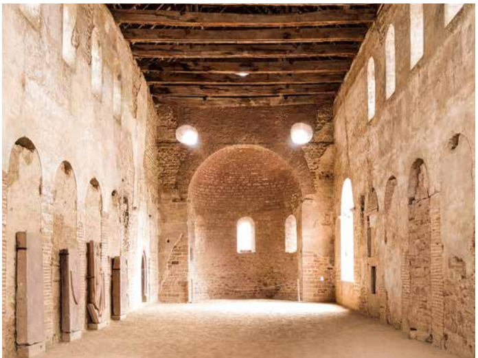
Mittelschiff, Blick nach Osten

Man betritt die dreischiffige Basilika durch das Westportal und blickt nach Osten auf die Apsis des Hauptchores. Der typisch karolingische Sakralraum im Inneren beeindruckt durch seine Schlichtheit. Einziger Schmuck war zu Einhards Zeit ein umlaufender, farbiger Fries oberhalb der Fenster. An einigen Stellen ist er noch sichtbar.