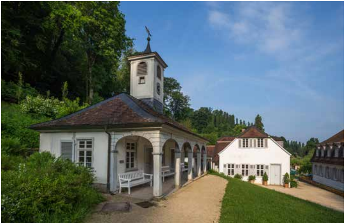
weitere Vermietungsbeispiele: Wachthäuschen