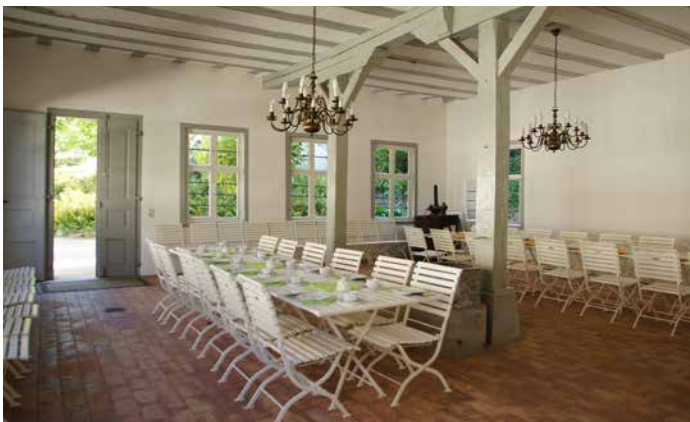
Vermietungsbeispiele: oben Küchenbau | unten Glashaus

E-Mail: heike.urner@schloesser.hessen.de