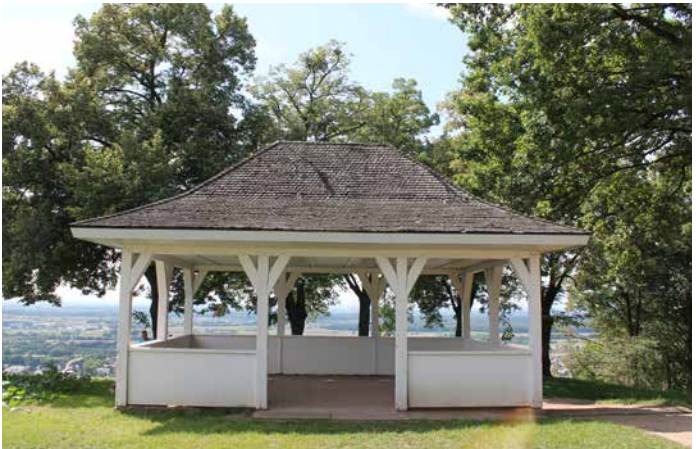
oben: Teehaus am Altarberg | unten: Freundschaftstempel