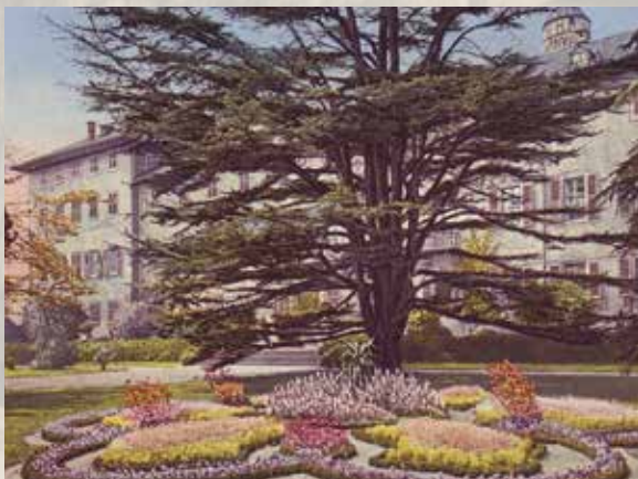
Historische Ansicht Schloss Homburg, um 1900