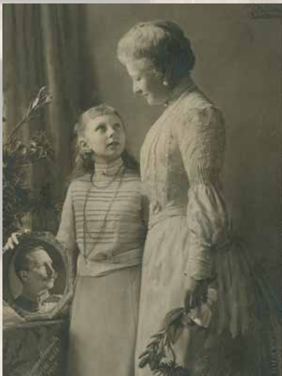
Kaiserin Auguste Viktoria und Prinzessin Viktoria Luise, 1903