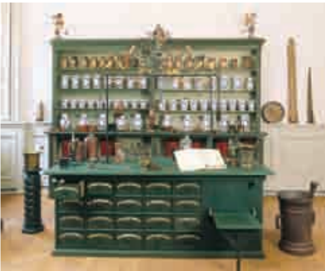
Arbeits- und Verkaufsraum der Klosterapotheke, seit 2002 restauriert

Die Seligenstädter Klosterapotheke wurde 2002 mit originalen Ausstattungselementen neu eingerichtet. Sie geht auf den von Gicht geplagten Abt Petrus IV. (1715-1730 amtierend) zurück. Die Apotheke verarbeitete auch nach der Säkularisation des Klosters im Jahr 1803 und der damit verbundenen Umnutzung als Stadtapotheke Heilkräuter des Klosters. Dies ergibt sich aus einer Instruktion für die Apotheker der Großherzoglich Hessischen Provinz Starkenburg von 1811.