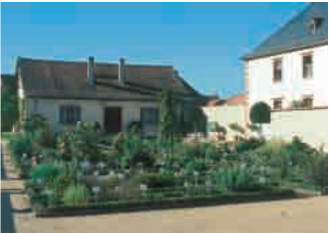
Der Apothekergarten im Kloster Seligenstadt

Der Garten wird gemäß der historischen Vorlage von einem rechtwinkligen Wegesystem mit zwei Haupt- und einer Nebenachse gegliedert. Die Wege haben eine Breite von 60 cm, ein Maß, das sowohl in der Literatur als auch in anderen historischen Gärten vorgefunden wurde. Sie sind nicht nur gliederndes Element, sondern dienen gleichzeitig der Nutzung und leichteren Pflege des Apothekergartens. Als Stellkante zur äußeren Abgrenzung wurde Sandstein verwendet, für die innere Begrenzung Eichenholzbretter. Die kleinen Wege erhielten eine Rindenmulchabdeckung.