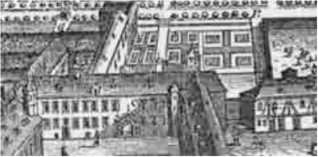
Ausschnitt aus dem Kupferstich von Johann Stridbeck, um 1712

Der 1999 wiederhergestellte Apothekergarten im Kloster Seligenstadt ist in seiner äußeren Gestaltung der Versuch einer Rekonstruktion des Zustandes aus dem 18. Jahrhundert. Die Einteilung der Flächen ist aus dem um 1712 entstandenen Kupferstich von Johann Stridbeck abgeleitet, wobei die erst 1757 errichtete Orangerie einbezogen wurde.